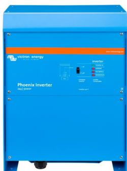
Phoenix Inverter 24/5000