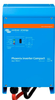
Phoenix Inverter Compact 24/1600

Les possibilités des convertisseurs puissants en parallèle sont réellement surprenantes. Pour en savoir plus sur les batteries, les configurations possibles et des exemples de systèmes complets, veuillez consulter notre livre « Energie Sans Limites » (disponible gratuitement chez Victron Energy et en téléchargement sur www.victronenergy.com ).